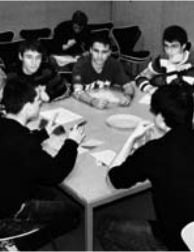
Regionalverhandlung südostafrikanische Gruppe

Die Gruppengrößen der einzelnen Rollen sind unterschiedlich. Als Beispiel gehen wir von einer Teilnehmerzahl von insgesamt 40 aus und schlagen davon ausgehend die Gruppengrößen vor.